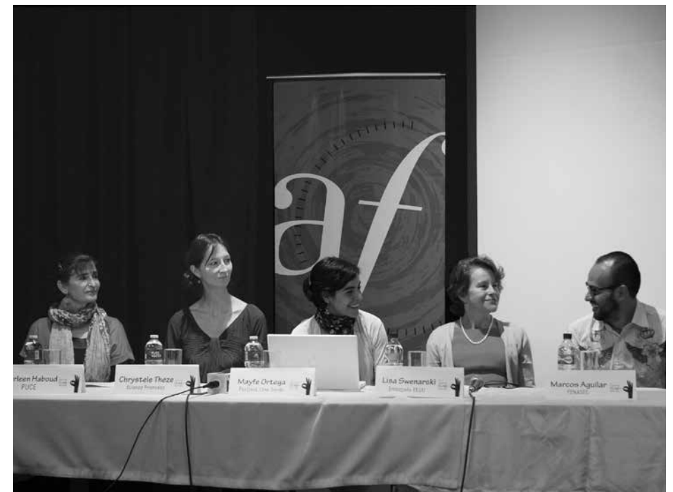
Rueda de prensa inaugural del Festival de Cine Sordo

Festival Cine Sordo ha sido la primera plataforma en Ecuador y Latinoamérica que, por medio de la exhibición de películas y de la realización de eventos académicos, buscó sensibilizar al público oyente ante la sordera y garantizar el acceso al cine de la comunidad sorda. Cada una de las actividades del festival, buscó motivar a la comunidad sorda para que genere sus propios audiovisuales, a los realizadores oyentes a producir materiales accesibles; y al público en general a la creación de espacios de intercambio y conocimiento del otro. Se buscó, al mismo tiempo, aprovechar los alcances del audiovisual para estrechar los lazos entre sordos y oyentes.