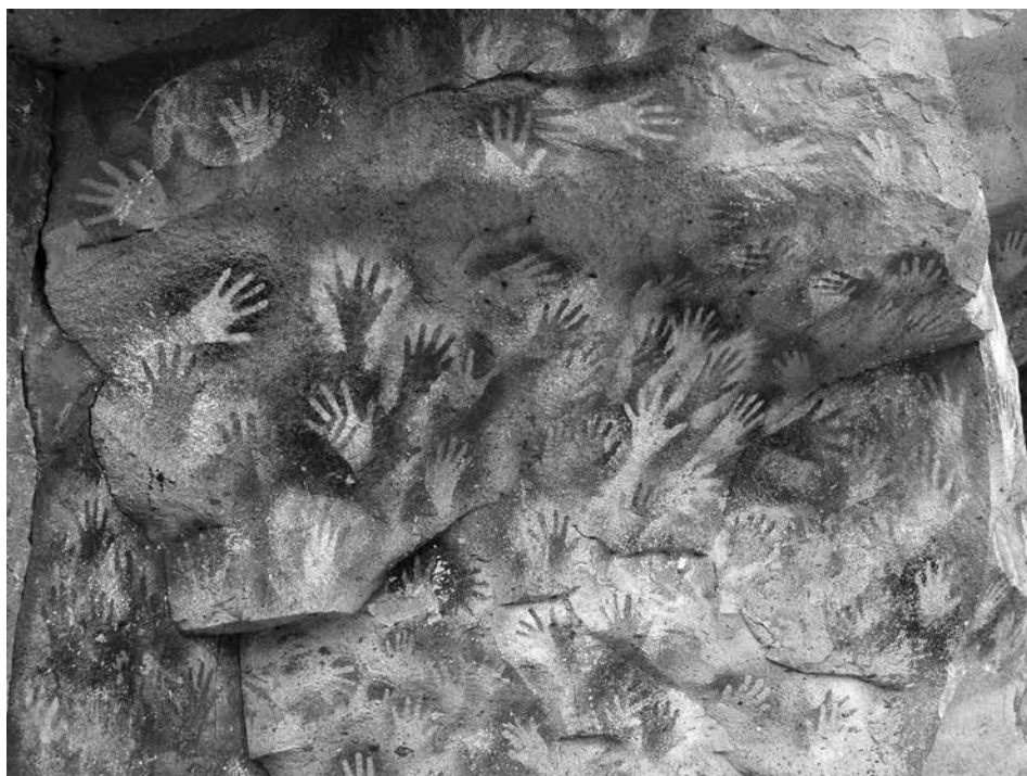
Figura 1: Cuevas de Altamira

Como podemos ver en la figura 1, con la aparición del hombre se da la lengua de señas. Hace mucho tiempo, en las cuevas de Altamira ya teníamos imágenes de manos, mensajes de manos. Eso es fascinante, sobre todo para alguien que no tiene contacto con personas que signan.