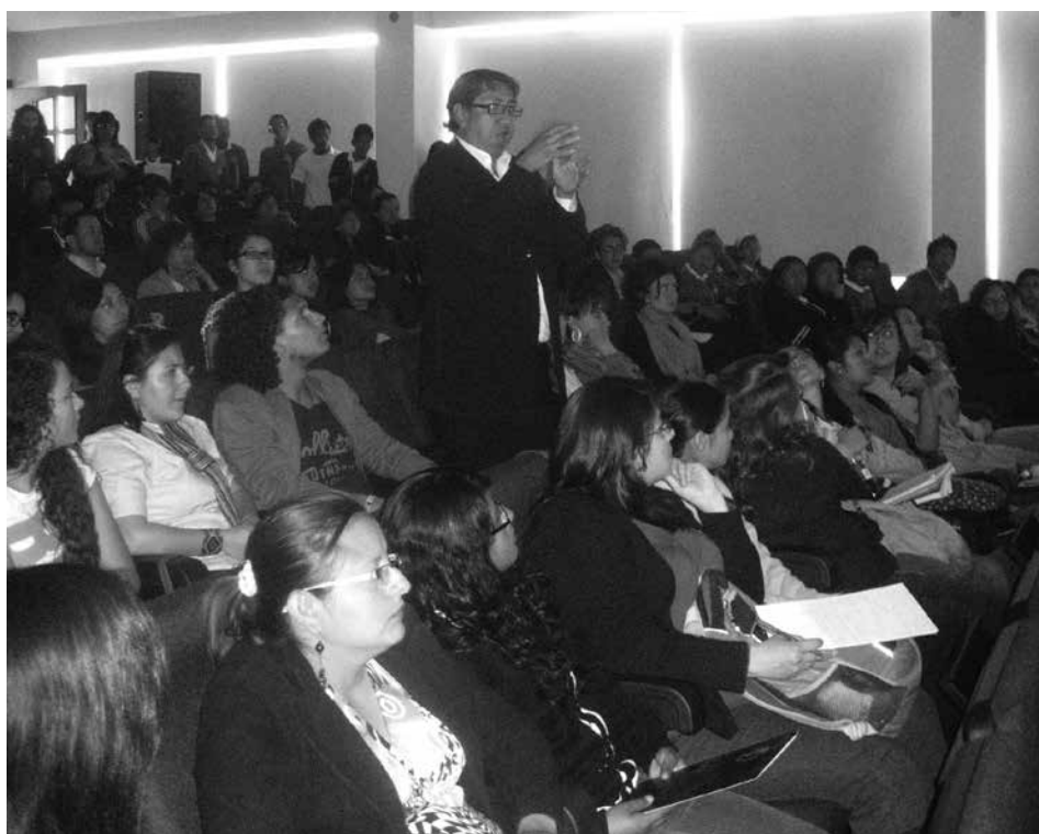
Participante en el Congreso

El Presidente ha implementado leyes que nos ha beneficiado y estamos contentos por esto, pero yo quiero dar mi punto de vista sobre las personas oyentes porque ellos se creen superiores a nosotros, y ese es el problema porque nosotros queremos darnos a conocer, mostrar nuestra cultura y así avanzar con estos temas de inclusión.