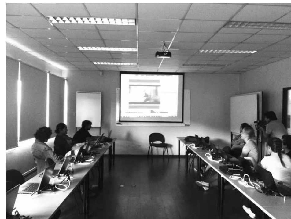
Taller de subtitulación