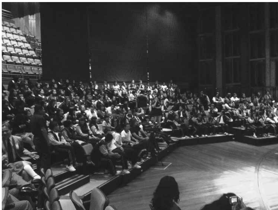
Función con estudiantes en el teatro México.

Entre el 29 de septiembre y el 7 de octubre de 2012, en las ciudades ecuatorianas de Quito, Cuenca y Guayaquil, se llevó a cabo la primera edición del festival que presentó una programación organizada en tres secciones: 1. largometrajes internacionales (8 documentales y 1 ficción que tuvieron como eje temático la sordera y la cultura sorda), 2. cortometrajes internacionales (14 ficciones realizadas por cineastas sordos) y, 3. películas ecuatorianas subtuladas para volverlas accesibles a la comunidad sorda; de este modo se logró difundir algo del cine nacional entre la comunidad sorda ecuatoriana. Toda proyección contó con la presencia de un intérprete de lengua señas ecuatoriana 2 .