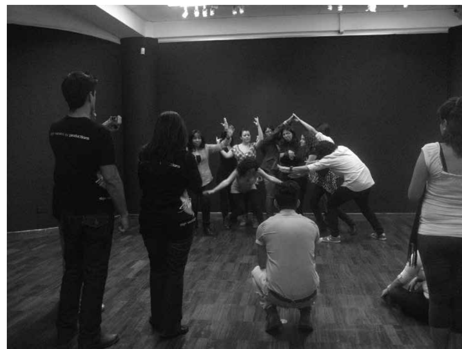
Taller de teatro con CJ Jones

Durante el Festival Cine Sordo (FCS) y el evento Voces e Imágenes que Unen, CJ Jones hizo, realizó actividades en la que involucró al público