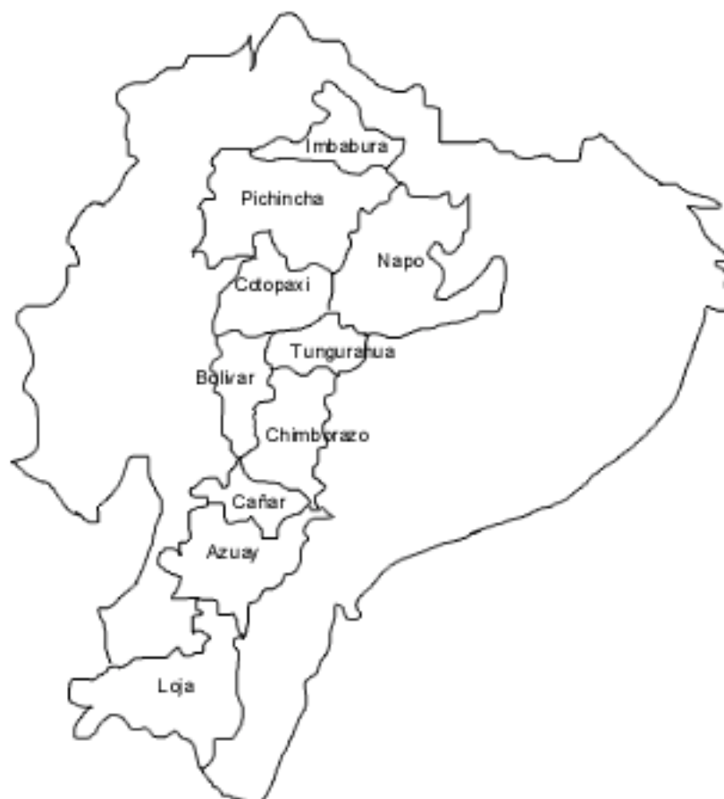
Figura 1. Las nueve provincias del estudio

El quichua sigue estando estrechamente relacionado con los territorios más nativos y el castellano con los espacios más mestizos y con un proceso de mestizaje, sin embargo las dos lenguas están en continua interacción de tal suerte que cada una se vuelve vulnerable a la presión de la otra. Como afirma King (1999) para el caso de una de las provincias sureñas del país, Loja, la compartimentalización de las lenguas se ha ido perdiendo y el quichua va disminuyendo su ámbito de acción. Esto es más que una simple advertencia sobre la disminución de la función comunicativa del quichua.