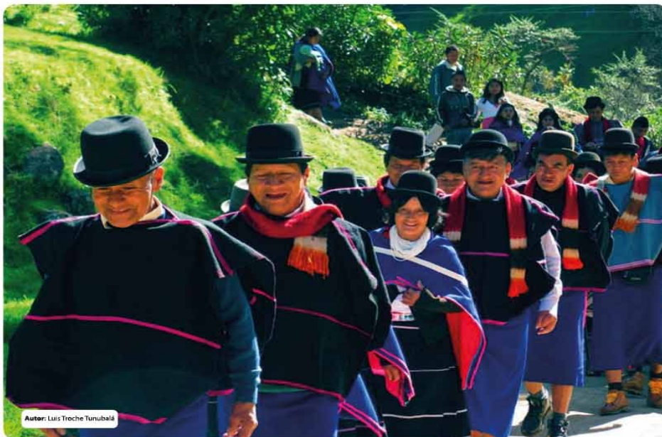
Autor: Luis Troche Tunubalá