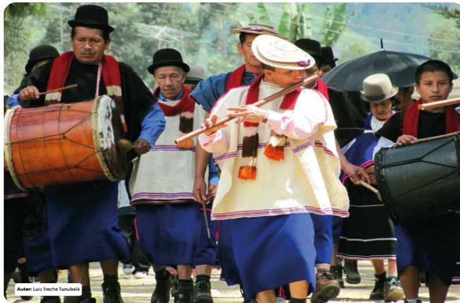
Autor: Luis Troche Tunubalá