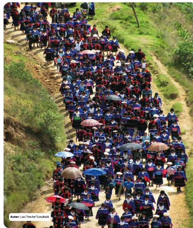
Autor: Luis Troche Tunubalá