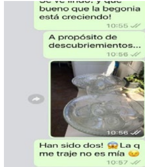
Foto 1. Uso del presente perfecto compuesto en un chat de WhatsApp