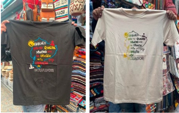
Foto 2 y 3: Camisetas de venta en uno de los mercados artesanales de Quito

b. Alguien que me quiere mucho me ha traído esta camiseta.