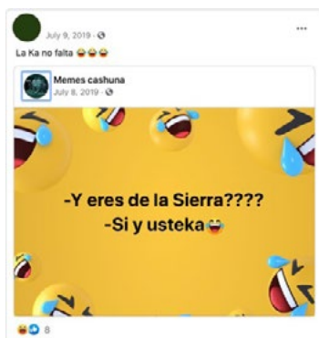
Foto 5. Uso del -ka en redes sociales

Fuente: Publicación de estado de uno de los autores.