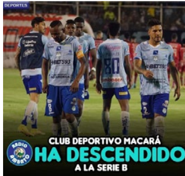
Foto 4. Uso del presente perfecto compuesto en un medio de comunicación