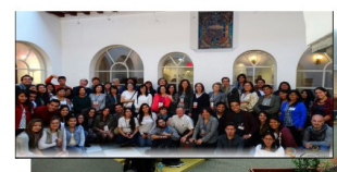
Publications and Symposia