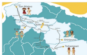
4 localidades San Mateo - Esmeraldas El Postero - Santo Domingo Shiripuno - Napo Toñampari - Pastaza